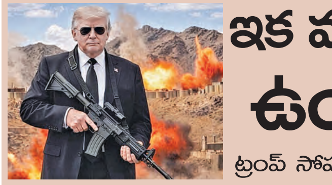
ట్రంప్ సోఫల్ మీడియా 'ట్రూత్'లో పోస్టు

కేరళలో మళ్ళీ ఎల్డీఎఫ్, తమిళనాట అదే డీఎంకె! అసోంలో మళ్ళీ బిజెపికి పట్టం, ఎర్నాటూల్ వెల్లడి న్యూఢిల్లీ, ఏప్రిల్ 29: బెంగాల్ లో రెండో విడత పోలింగ్ ముగిసిన వెంటనే దేశంలో ఐదు రాష్ట్రాలకు జరిగిన ఎన్నికల్లో వివిధ పార్టీల బలాబలాలుపై ముందస్తు అంచనాలు వెల్లడి అయ్యాయి. వివిధ సంస్థలు నిర్వహించిన ఎగ్జిట్ పోలింగ్ లో బిజెపి ఎన్టీయే మిత్రపక్షాలు కొన్నిచోట్ల అధిక్యంలో ఉంటాయని చెప్పే తమిళనాడులో డీఎంకె, కేరళలో యుడిఎఫ్ లు సర్కారు ఏర్పాటుచేస్తాయన్న అంచనాలు వెల్లడించాయి. రెండోవిడతగా పశ్చిమబెంగాల్ లో జరిగిన పోలింగ్ లో కూడా తీవ్ర ఉద్రిక్త భరితంగా కొనసాగింది. 90శాతం పోలింగ్ జరిగిందన్న అంచనాతో ఎన్టీయే కూటమి తాము అధికారం చేపట్టడం ఖాయం అన్న దిశగా ఉంది. అలాగే అసోంలో హిమంత బిశ్మిక్ సేనాత్మకంగానే బిజెపి మళ్ళీ సర్కారు ఏర్పాటుకావాలని అన్న రీతిలో ఉంది. వివిధ సంస్థలు నిర్వహించిన ఎగ్జిట్ పోలింగ్ ఈ విధంగా ఉన్నాయి. >>2