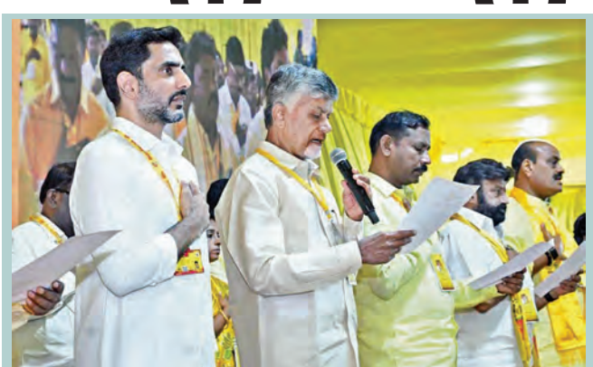
బుధవారం టీడీపీ నూతన కార్యవర్గ ప్రమాణ స్వీకార దృశ్యం

విజయవాడ, ఏప్రిల్ 29, ప్రభాతవార్త ప్రతినిధి: టీడీపీకి అధినేత కార్యకర్త అనేది నినాదం కాదని, సిద్ధాంతమే తెలుగుదేశం పార్టీ జాతీయ అధ్యక్షుడు, సీఎం చంద్రబాబు నాయుడు స్పష్టం చేశారు. త్వరలో జరగనున్న స్థానిక సంస్థల ఎన్నికల్లో ఏకపక్షంగా విజయం సాధించాలని ఏపీ చంద్రబాబు నాయుడు పిలుపునిచ్చారు రాష్ట్ర వ్యవస్థాపక కార్యదర్శి ప్రజలు కూటమికి ఓటేసారని, వారి నమ్మకాన్ని నిలబెట్టుకోవాలని చంద్రబాబు అన్నారు. మరో మూడేళ్లలో మళ్ళీ ఎన్నికలు వస్తాయి. 2024లో వచ్చిన ఓట్ల కంటే ఎక్కువ ఓట్లు సాధించాలి. అప్పుడే మనం బాగా పనిచేసినట్లు. వన్ టైమ్ ఎమ్మెల్యేలుగా ఉండొద్దు, మళ్ళీ మళ్ళీ గెలవాలి. పనిచేసిన వారికే పదవులు వస్తాయి పని చేసిన వారికే పదవులిస్తామని తెలిపారు. టీకెఎల్ ఇచ్చిన వారి వెంటే కార్యకర్తలు ఉంటారనే విషయం ప్రతి లీడరు గుర్తు పెట్టుకోవాలి, ఇదే టీడీపీ స్వేచ్ఛాల్ని అని తెలుగుదేశం అధినేత, సీఎం చంద్రబాబు స్పష్టం చేశారు. టీడీపీ నూతన కార్యవర్గ ప్రమాణస్వీకార కార్యక్రమంలో చంద్రబాబు